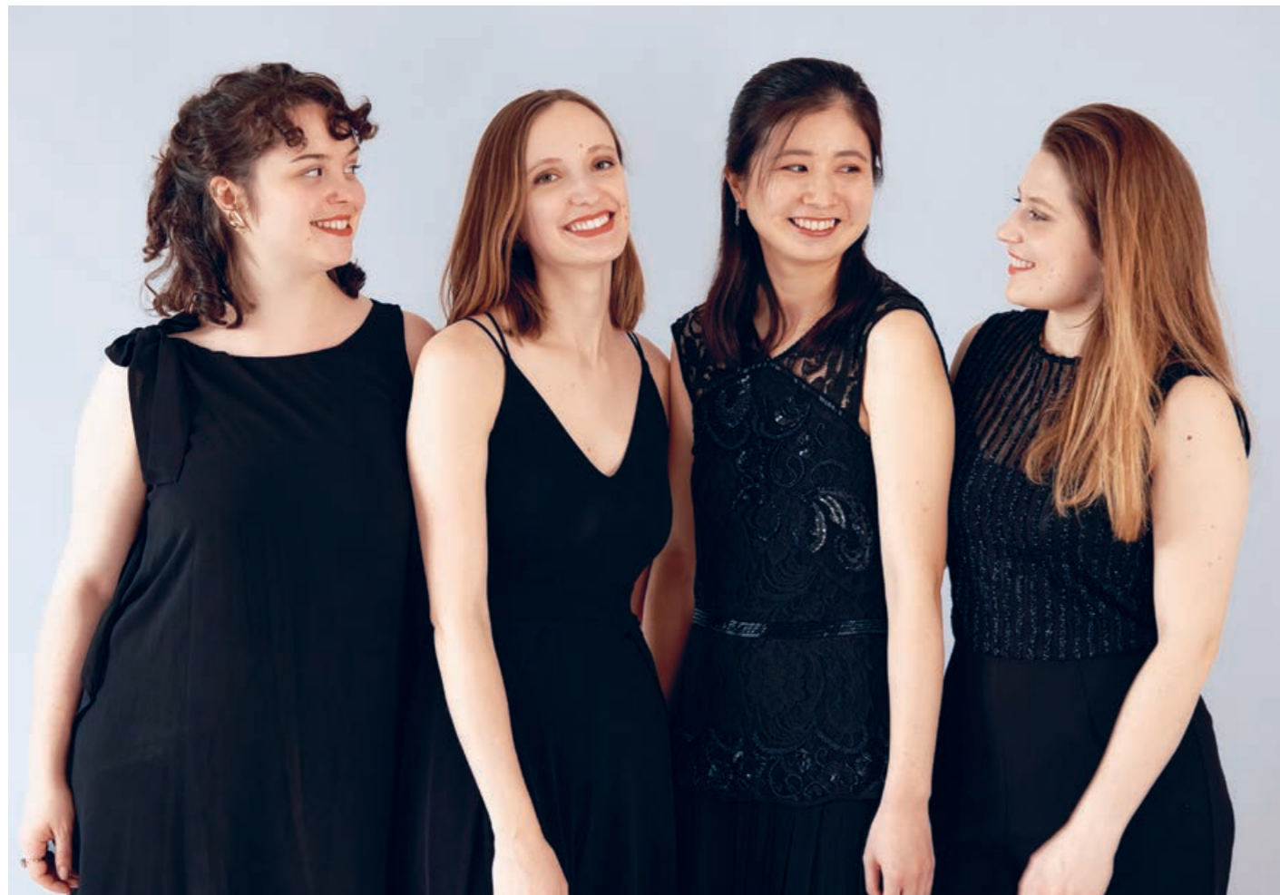
Moser String Quartet